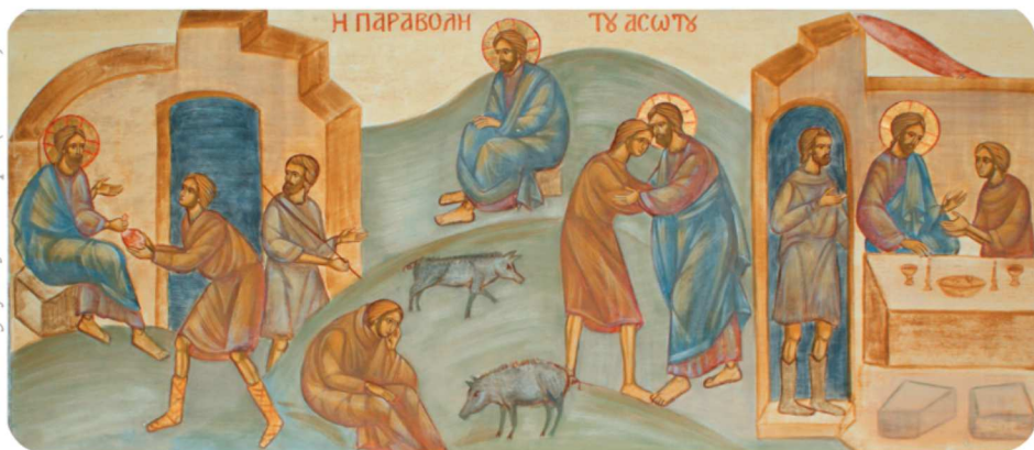
Fresque du Fils prodigue - refectoire