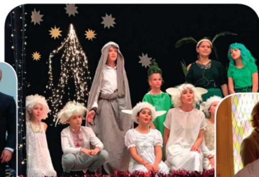
Fête de Noël